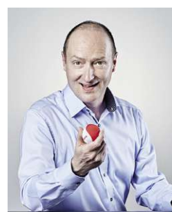
Cornel Jacquemai Leiter c-net